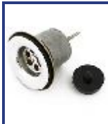
SOPAPA LAVAT REF P/PVC AC INOX