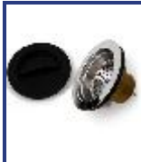
SOPAPA PILETA AMERICANA