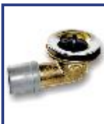
SOPAPA BAÑERA CODO TSD CROMO