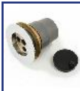
SOPAPA PILETA ROSC LARGA P/PVC 1 1/2