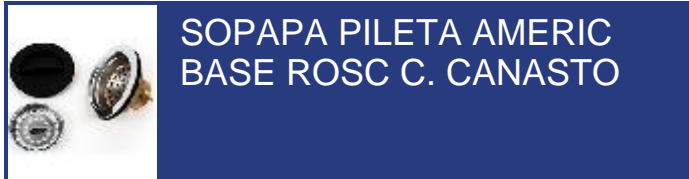
SOPAPA PILETA AMERIC BASE ROSC C. CANASTO