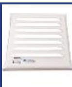
REJ VENT 20X20 AMURAR APROB 100CM2