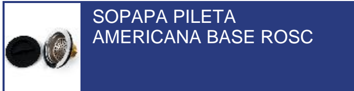
SOPAPA PILETA AMERICANA BASE ROSC