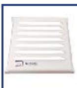
REJ VENT 15X15 AMURAR/ATOR APROB 100CM2