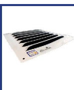
REJ VENT 20X20 ATOR APROB 100CM2