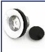
SOPAPA BAÑERA RECTA CROMO