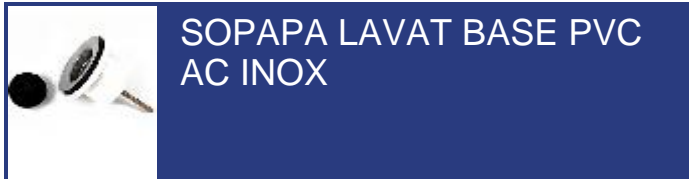
SOPAPA LAVAT BASE PVC AC INOX