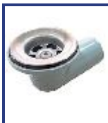
SOPAPA BAÑERA CODO PVC