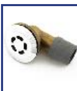
SOPAPA BAÑERA DESBORDE TSD CROMO