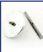
SOPAPA TAPA ANULA DESB C/PILAR CROMO