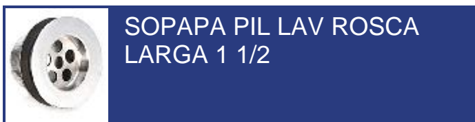
SOPAPA PIL LAV ROSCA LARGA 1 1/2