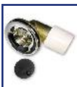
SOPAPA BAÑERA CODO TORNILLO TSD CROMO