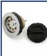
SOPAPA PILETA TORNILLO AC INOX