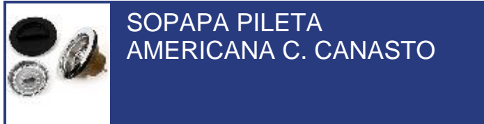
SOPAPA PILETA AMERICANA C. CANASTO