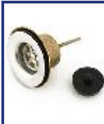
SOPAPA LAVAT BASE BRONCE AC INOX