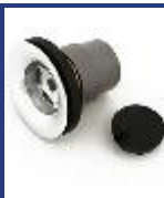
SOPAPA BAÑERA RECTA TSD CROMO