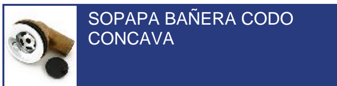
SOPAPA BAÑERA CODO CONCAVA