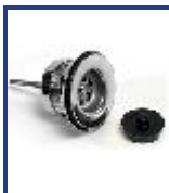
SOPAPA LAVAT COMUN C/TUERCA AC INOX CROMO