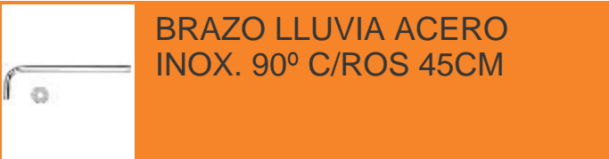
BRAZO LLUVIA ACERO INOX. 90° C/ROS 45CM