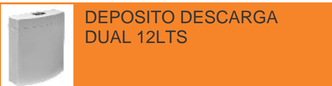
DEPOSITO DESCARGA DUAL 12LTS