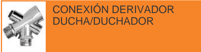
CONEXIÓN DERIVADOR DUCHA/DUCHADOR