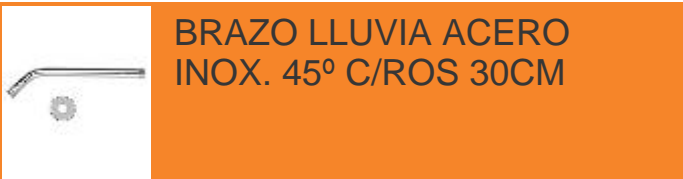
BRAZO LLUVIA ACERO INOX. 45° C/ROS 30CM